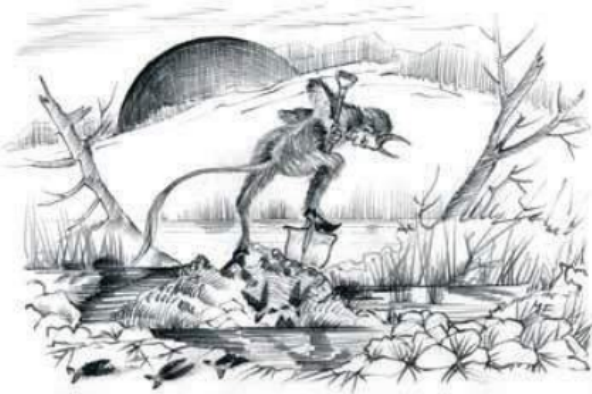
Vanahalv tege Tsolgot.