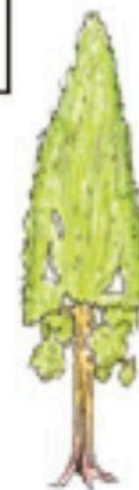
SAARÕ HIPÕ JA EVARI TSEHKENDÜSE