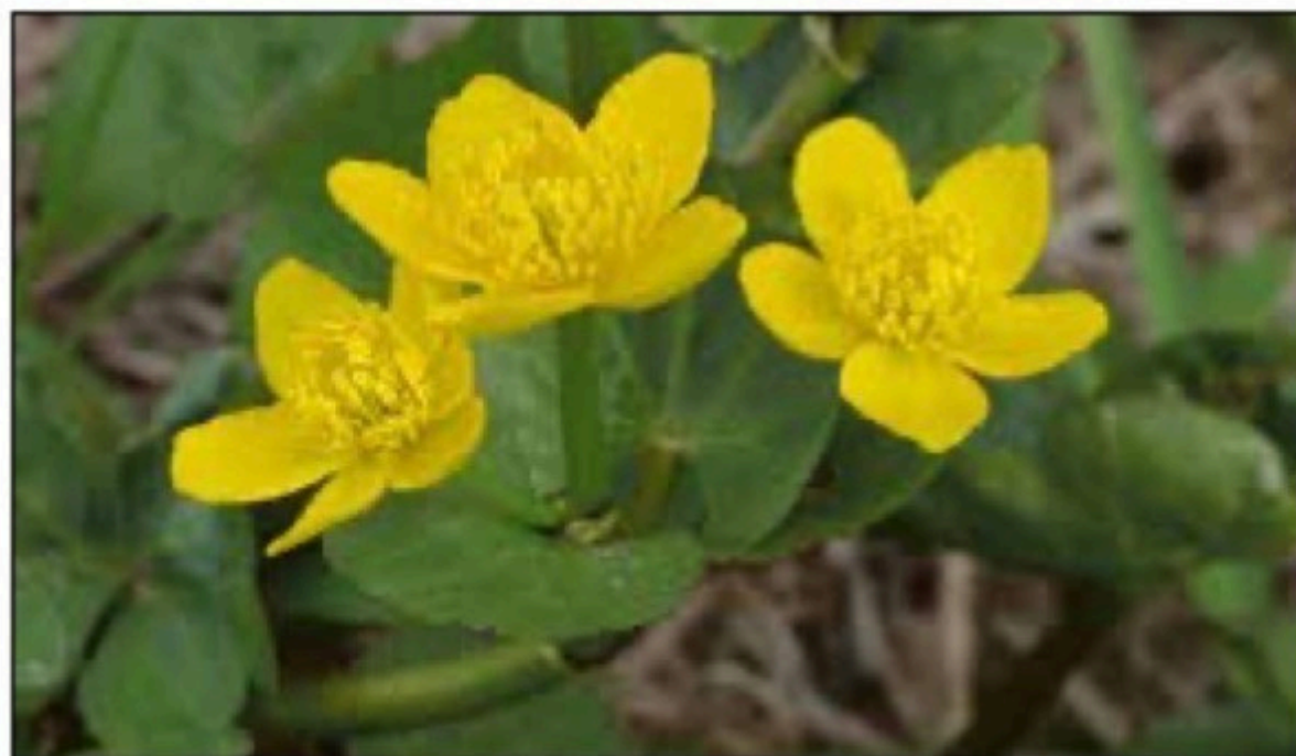
FASTRÕ MARIKO PILT